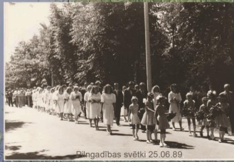
Dūngdabības svētki 25.06.89