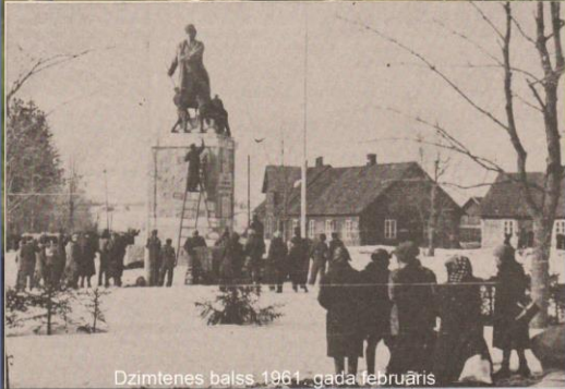
Dzimtenes balss, 1961. gada februāris