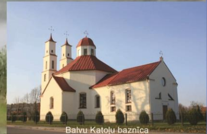
Balvu Katoļu baznīca