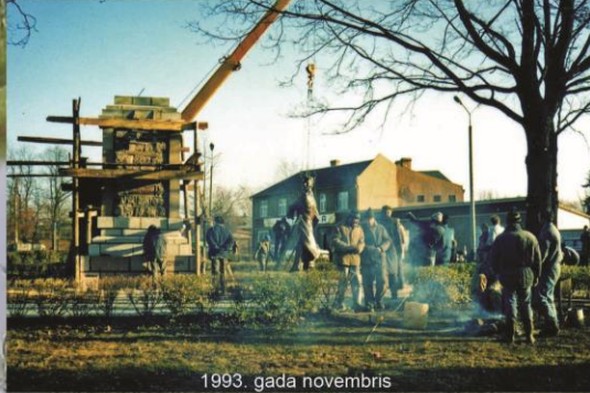
1993. gada novembris