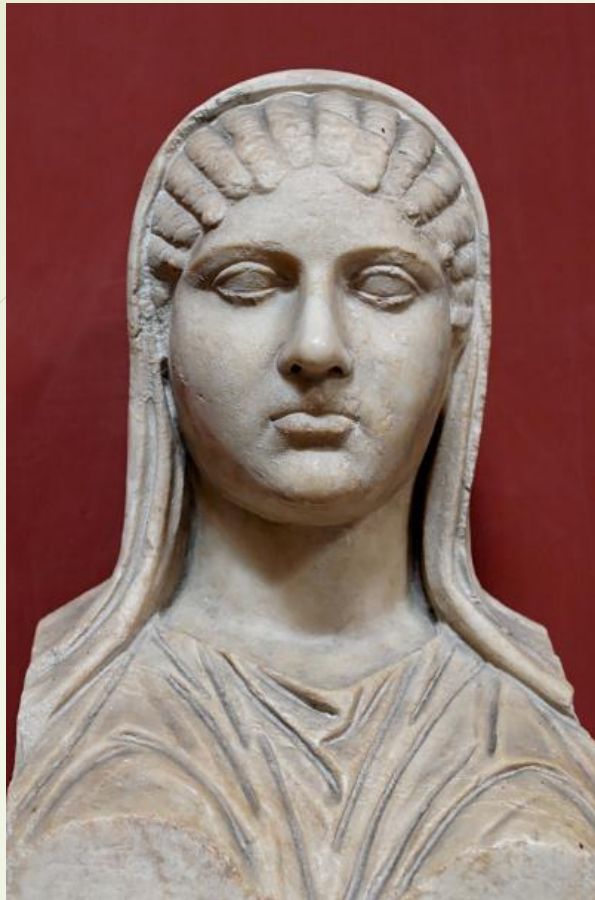
1. attēlā - Aspazijas biste, Vatikāna muzejs

* paaugstinātas grūtības pakāpes uzdevums