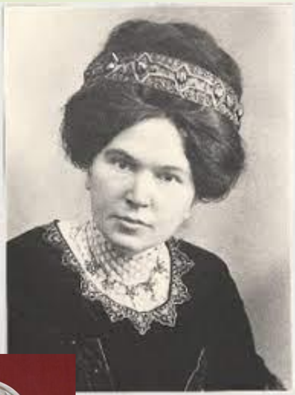
Aspazija/ Johanna Emīlija Lizete Rozenberga, vēlāk — Elza Pliekšāne (1865 – 1943)