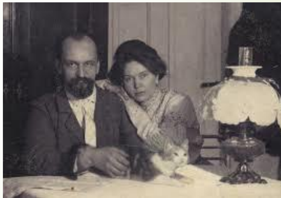
Rainis/ Jānis Krišjānis Pliekšāns (1865 – 1929)